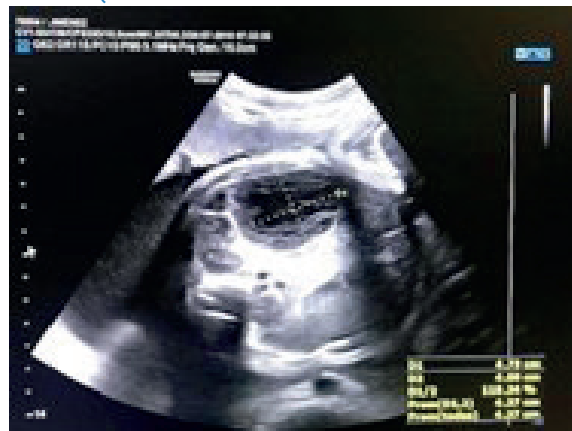
FIGURA 3. QUISTE ANEXIAL A LAS 35 SEMANAS.

A las 39 semanas con 6 días, fue derivada al hospital de referencia, porque inició trabajo de parto que culminó en parto eutócico de una niña de 3 880 g (percentil 75-90) con Apgar 9/10. A la exploración física por aparatos, no hubo hallazgos patológicos. Valorada por cirugía pediátrica al nacimiento, se solicitó ecografía abdominal y marcadores tumorales. En la ecografía abdominal se evidenció gran masa intraabdominal que ocupaba el hemiabdomen anterior izquierdo y medía 6,2 x 3,6 cm de diámetros mayores, heterogénea, con lesión redondeada predominantemente ecogénica central de 3,5 x 3,4 cm, rodeada por imagen anecoica/quística de 4,5 cm de eje largo que, a su vez, estaba sobre una estructura ovalada hipoecoica y con múltiples