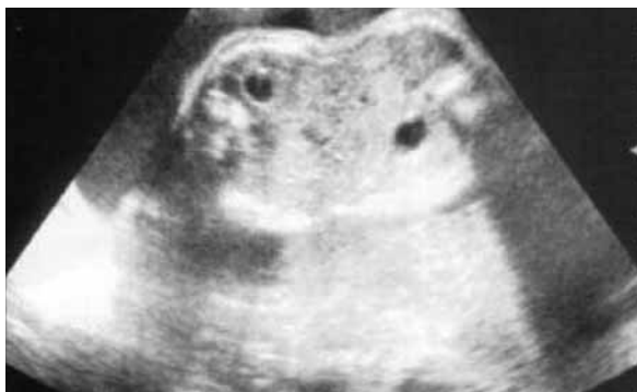
Figura 2. Fetos siameses unidos por el abdomen.

El reporte de anatomía patológica fue el siguiente: