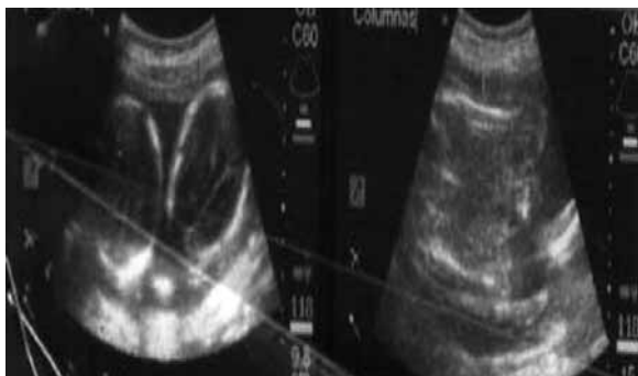
Figura 1. Ecografía realizada en el Hospital Jamo-Tumbes.