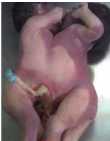
Figura 5. Siamesas toracoabdominópagos.