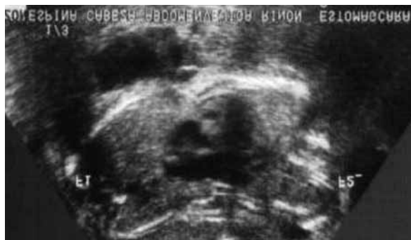
Figura 3. Fetos siameses con corazón único.